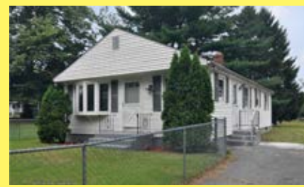
Ranch CUMBERLAND $229.900