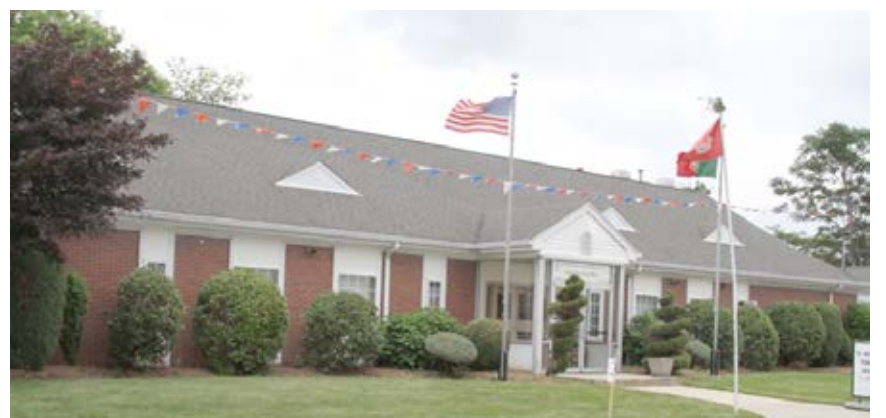
O edifício do Centro Cultural de Santa Maria