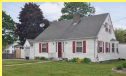
Cape RIVERSIDE $269.900