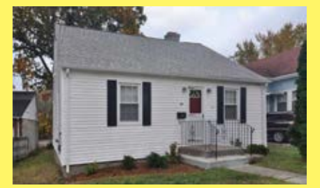
Cape PAWTUCKET $194.900