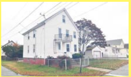
2 Moradias EAST PROVIDENCE $269.900