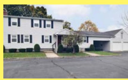
2 Moradias EAST PROVIDENCE $369.900