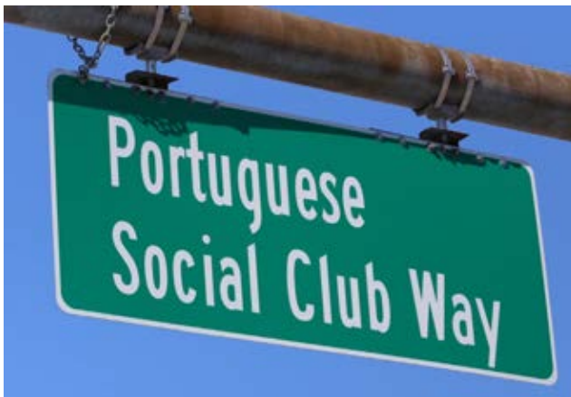
A placa que identifica a nova rua com o nome de Portuguese Social Club Way e que foi inaugurada na manhã do passado sábado, com a presença de entidades locais, estaduais e federais.