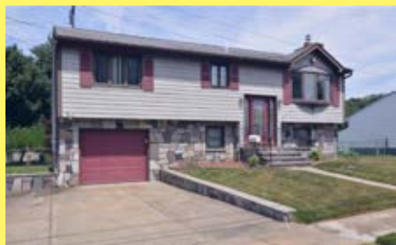
Raised Ranch EAST PROVIDENCE $299.900