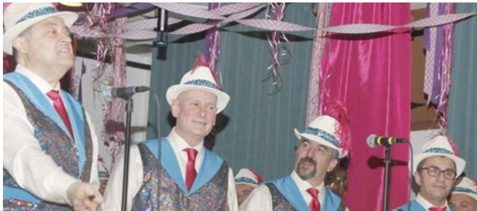
As fotos acima e abaixo documentam passagens do bailinho “Vícios e Costumes”.