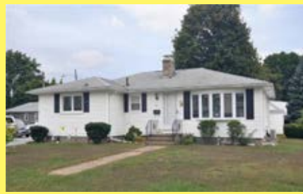
Ranch JOHNSTON $249.900