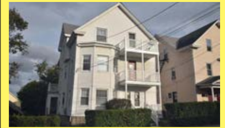
3 Moradias PAWTUCKET $349.900