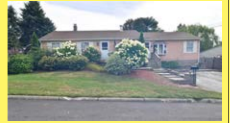
Ranch EAST PROVIDENCE $249.900