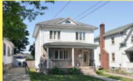
Colonial EAST PROVIDENCE $239.900