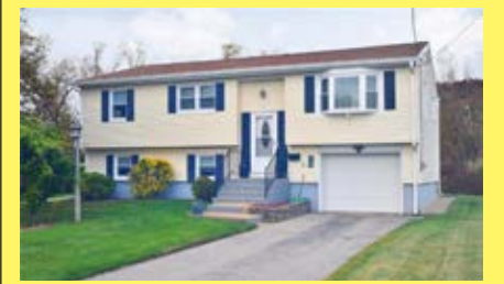
Raised Ranch EAST PROVIDENCE $259.900