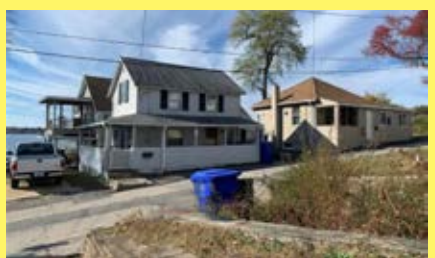
2 Moradias RIVERSIDE $249.900