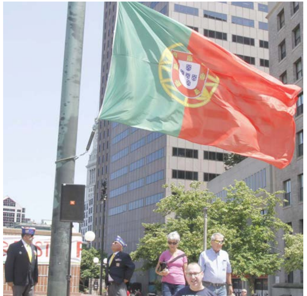
O momento em que a bandeira portuguesa era hasteada no City Hall Plaza em Boston, palco para o Boston Portuguese Festival tendo atraído milhares de pessoas vindas de diversas localidades da Nova Inglaterra.