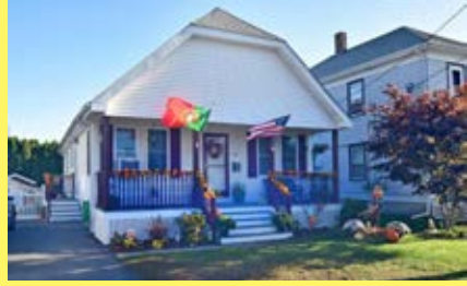
Bungalow PAWTUCKET $259.900