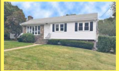
Ranch EAST PROVIDENCE $289.900