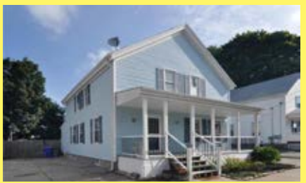
Cottage EAST PROVIDENCE $254.900