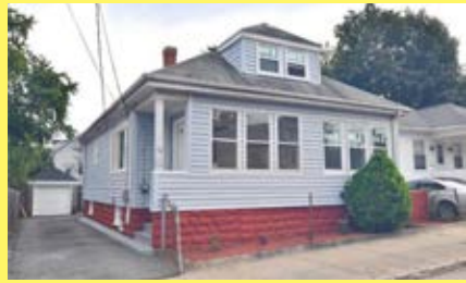
Bungalow PAWTUCKET $214.900