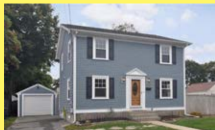
Colonial RUMFORD $279.900