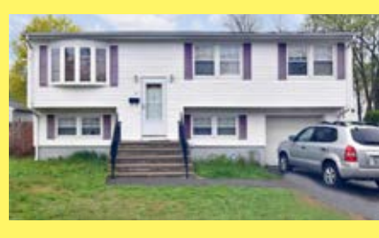
Raised Ranch EAST PROVIDENCE $219.900