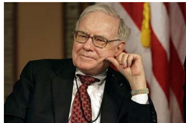
Warren Buffett tem 89 anos e 89 biliões de dólares.

Um dos argumentos republicanos é que Trump é muito rico, sabe ganhar dinheiro e fazer prosperar o país. Sendo assim é mais vantajoso votar em Bloomberg, cuja fortuna supera 52 biliões de dólares, muito superior aos três biliões de Trump. Ou então em Warren Buffett, que tem 89 anos de idade e uma fortuna de 89 biliões de dólares, e se calhar dava um grande presidente.