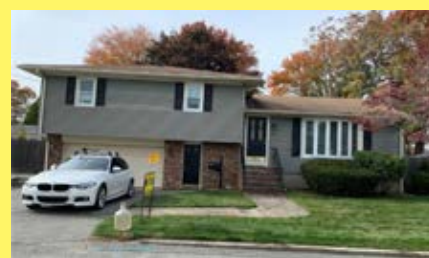
3 Moradias EAST PROVIDENCE $299.900